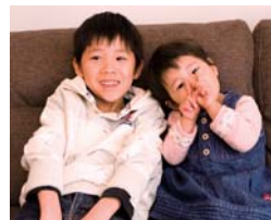
仲良しの兄妹。素敵な邸宅に子どもたちの明るく楽しい笑い声が響く