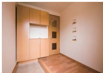
広々とした玄関。クリスマスやお雛様など季節の小物を飾ると可愛いニッチは標準装備