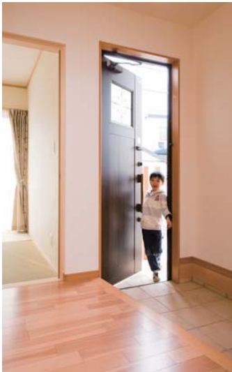
元気いっぱいの子どもたちが我が家に帰ってくるのが楽しくなるような気持ちのよい玄関