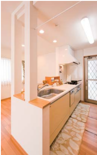
明るく使いやすいキッチン。耐震的に重要な柱もキッチンのアクセントとしてデザイン