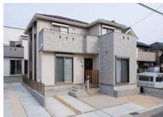
すっきりと洗練された外観。明るく日当たりのよい立地を生かした快適なマイホーム