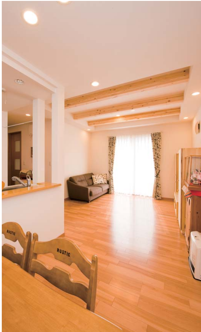
雑誌やインターネットでお気に入りのインテリアをトコトン探しました。「木の梁はどうしても付けたかった」とリビングの天井にリズムカルに並べられた木目の美しい梁がお部屋のアクセント